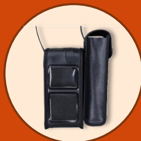
キャリングケース