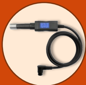
アキシアル型プローブ